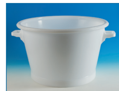
Baquets blancs renforcés