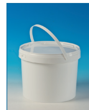
Seaux 100% étanches, inviolables. Poignée ergonomique. Anse plastique. Un « clic » confirme la fermeture. Couvercles en option.