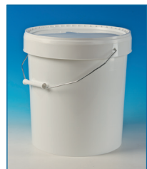
Seaux 100% étanches, inviolables. Poignée ergonomique. Anse métal. Un « clic » confirme la fermeture. Couvercles en option.