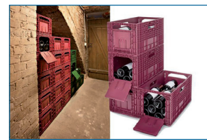
3 couleurs au choix