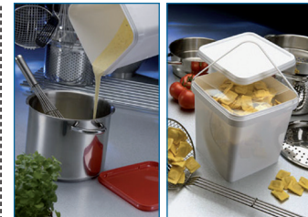
Seaux carrés 100% étanches. Anse plastique. Un « clic » confirme la fermeture.