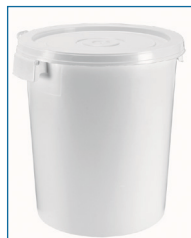
Seaux 100% étanches. Poignées coquille. Sans anse. Un « clic » confirme la fermeture. Couvercle en option.