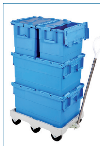
Caisses à couvercle solide.

Empilables sur couvercle. Fond et côtés pleins. Marque Gilac. Couleur : bleue. Ambiance : -20°C à +90°C.