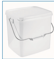
Seaux rectangulaires 100% étanches. Anse plastique ou métal (13,1 L). Un « clic » confirme la fermeture.