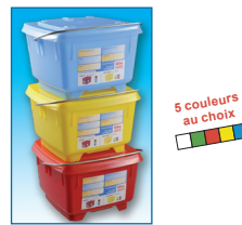
5 couleurs au choix