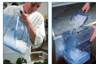
Seau à glace 21 L + support inox. Pelle à glace 2 L avec support inox.