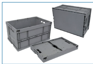
Caisses pliables sans couvercle.

Fond et côtés pleins. Empilables. Couleur : grise. Ambiance : -20°C à +90°C.