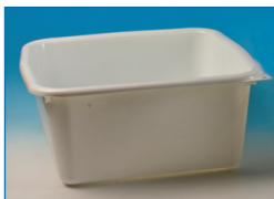
Cuvettes carrées ou rectangulaire