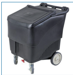
Distributeur de glace ou glaçons.

Contenance : 57 kg. Avec couvercle basculant. Certifié NSF. 2 roues fixes + 2 pivotantes. Robinet de vidange.